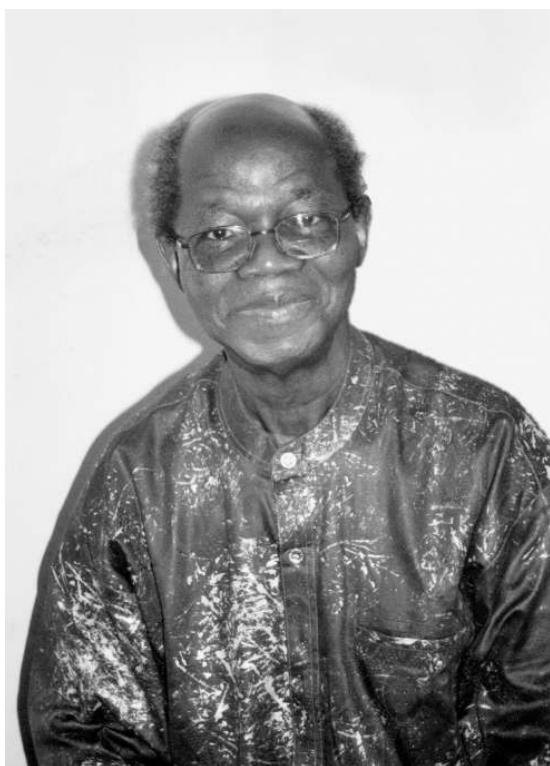
Fig. 1: J. H. Kwabena Nketia. Photo Wiggins, 2003

Puis-je commencer par vous interroger sur l'ICAMD (Centre international pour la musique et la danse africaines) ? Le Centre est bien établi mais comment voyez-vous son rôle ?