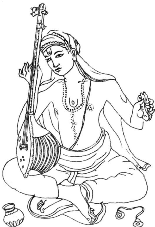
Fig. 1 : Tyāgarāja, dévot de Rāma

Si tu es allongé et que tu chantes sa louange Il s'assiéra tout prêt à t'écouter Si tu es assis et que tu chantes sa louange Il se lèvera et t'écouterà captivé Si tu te lèves et chantes sa louange Il dansera avec joie pour l'écouter Si tu dances et si tu chantes Purandara Vittala 15 te dira « Bienvenue au paradis ! » (Purandara Dāsa: 1998, 157).