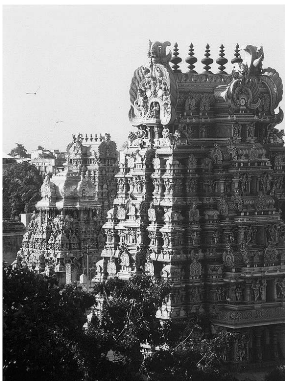
Fig. 3: Les Gopuram du temple de Madurai, Tamil Nādu