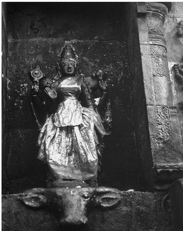
Fig. 2: Habiller, décorer, pratiquer les idoles, Dārāsūram, Tamil Nādu