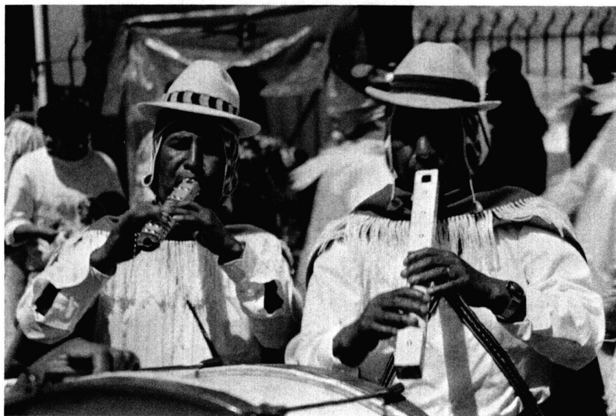
Fig. 3: Tarkeros quechuas lors du défilé de carnaval. La Paz, 26 février 1990.