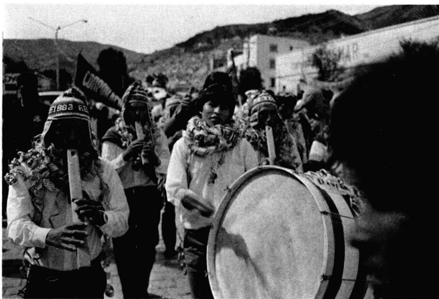
Fig. 2: Tarkeros aymaras du village d'Italaque (Bolivie). De gauche à droite: tarka curahuarera , tarka salina et bombo . La Paz, 26 février 1990.