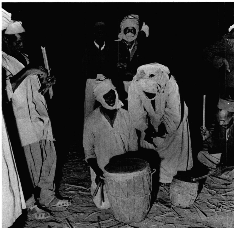
Fig. 1: Préparatifs et taille des baguettes avant le jeu des tambours nang'ara et kwelli .