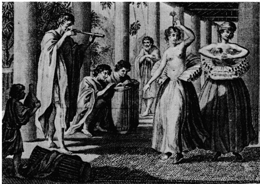
Fig. 2: Danseuses et musiciens jouant de la flûte nasale et du tambour dans l'île de Ulietée (Iles de la Société). Tiré de: Atlas – 2 e voyage de Cook , Paris: 1774: Tome III, pl. 6 (extrait). Légende originale: «Vue de l'intérieur d'une Maison dans l'Isle d'Ulietée. Représentation d'une danse à la mode du pays.»