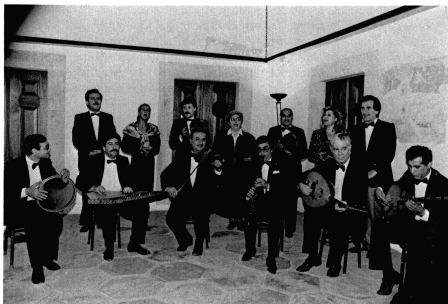
Fig. 3: Ensemble fasıl d'Istanbul: exemple de «modernisation» de l'ensemble traditionnel.