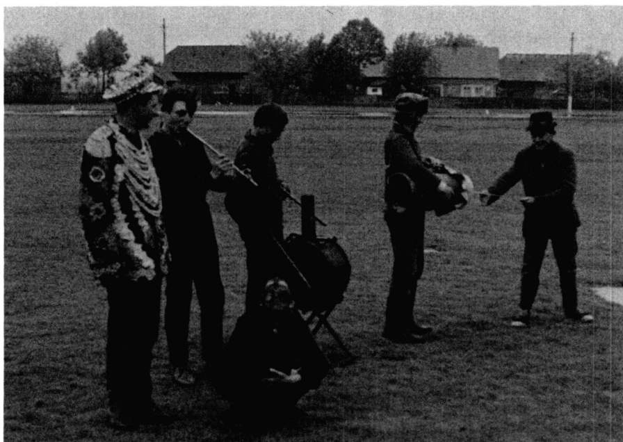
Fig. 2: Un groupe de jeunes ont sorti pour nous leurs instruments de musique qui accompagnent la troupe d'interprètes de théâtre populaire du Nouvel An. On y distingue une flûte longue, un tambour ( toba ) sur trépied et un buhai (littéralement «bœuf»), instrument exclusivement rituel qui accompagne les souhaits de fertilité du cycle des Douze jours. A l'avant-plan, un jeune homme en costume de théâtre et, accroupi, un autre portant un «masque à gaz», récupération de guerre, qui entre parfois dans ces travestis du Nouvel An. Village de Badauti (Moldavie du Nord), juin 1970. (Photo: M. Mesnil).

lăutari , «Zamfir le Roumain» devient l'incarnation de cette continuité pour l'Occident, mais aussi pour une nouvelle classe sociale à la recherche de son identité nationale 6 .