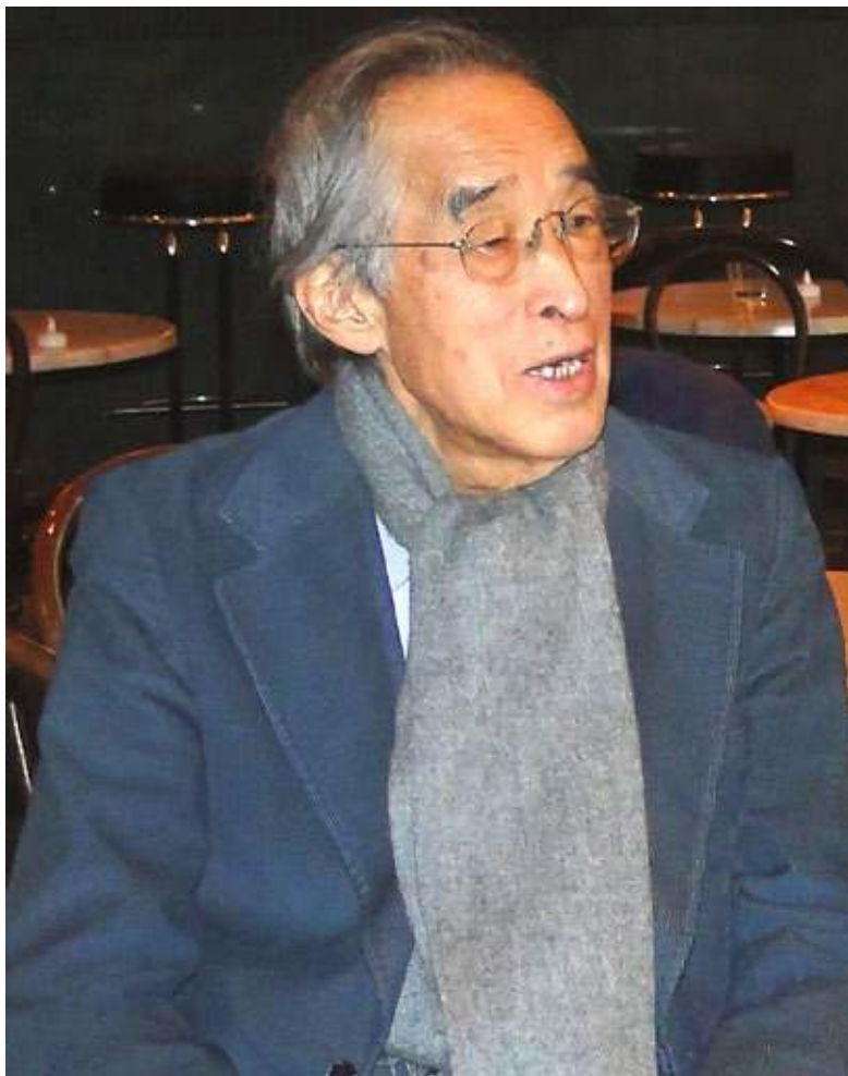
Fig. 1. Akira Tamba au théâtre de l'Alhambra de Genève, dans le cadre du festival Japon, jardins musicaux , organisé par les Ateliers d'ethnomusicologie. février 2012.

Vous étiez donc issu d'un milieu d'intellectuels ou bien votre père était-il le premier de votre famille à être versé dans les questions artistiques ?