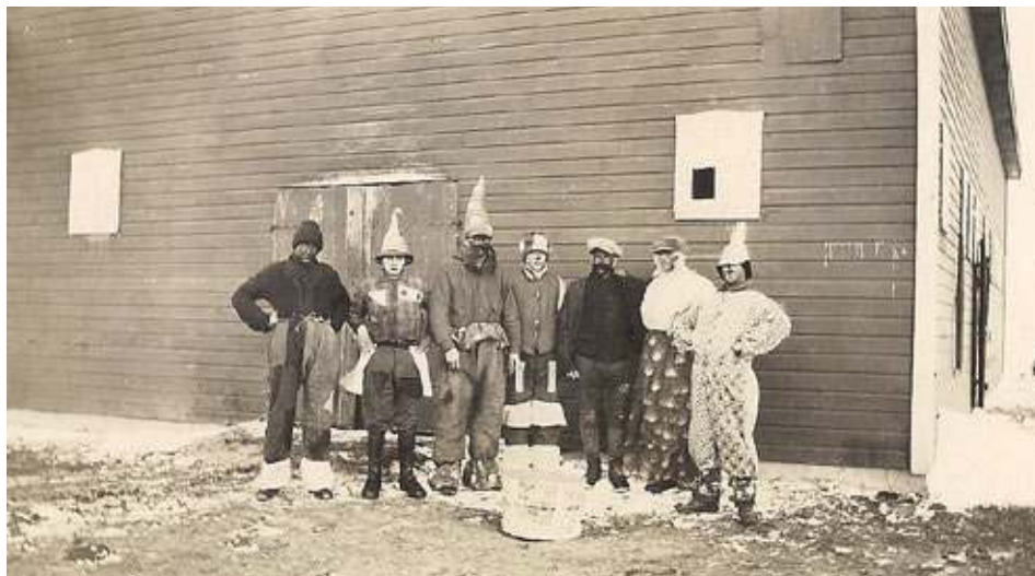
Fig. 2. Acteurs de Brommtopp de la région de Plum Coulée, le 31 décembre 1930.