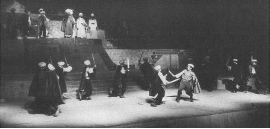
Fig. 3. Scène de la pièce Fakhr al-Din . Festival de Baalbek, 1966.

une ancienne chanson. Il ne se rappelle que l'incipit et aimerait qu'elle collecte le reste durant ses pérégrinations. Lorsqu'elle lui demande comment faire, il répond : « Écoute ! Dans chaque village se trouve une boutique, et dans chaque boutique un vieil homme... Tu n'as qu'à demander à chacun d'entre eux de t'apprendre un des mots de la chanson, et tu l'apprendras ainsi de la bouche des anciens » (Rahbani 1966 : 15-16).