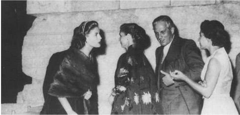
Fig. 4. Le président du Liban Camille Chamoun et son épouse, entourés de Aimée Kettaneh et May Arida, au Festival de Baalbek, 1957.

plus conforme aux « authentiques » sources populaires – ils n'avaient besoin que de quatre instruments de musique (Munassa 1994 : 17).