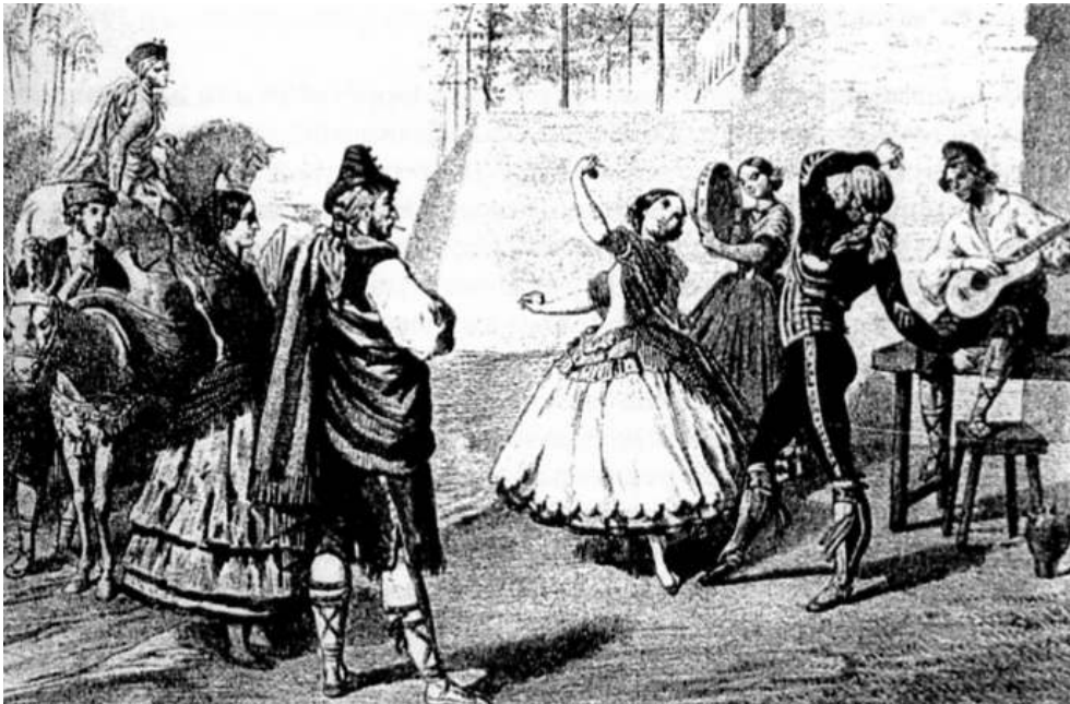
Fig. 1 : Lithogravure de Bocquin d'après un dessin de Leloir, XIX e siècle.