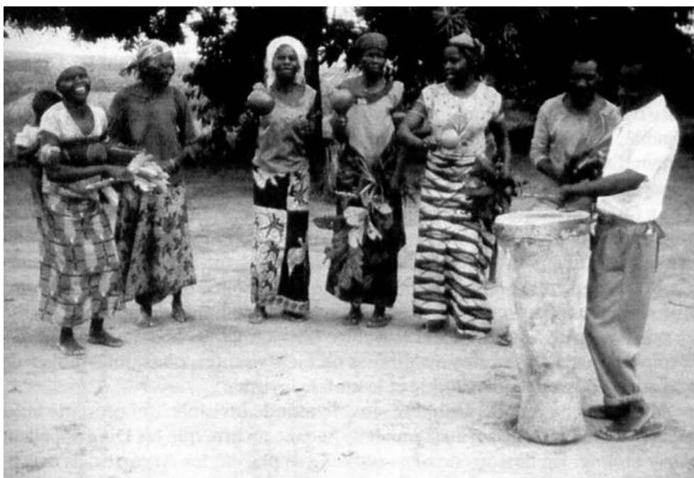
mars 1991.